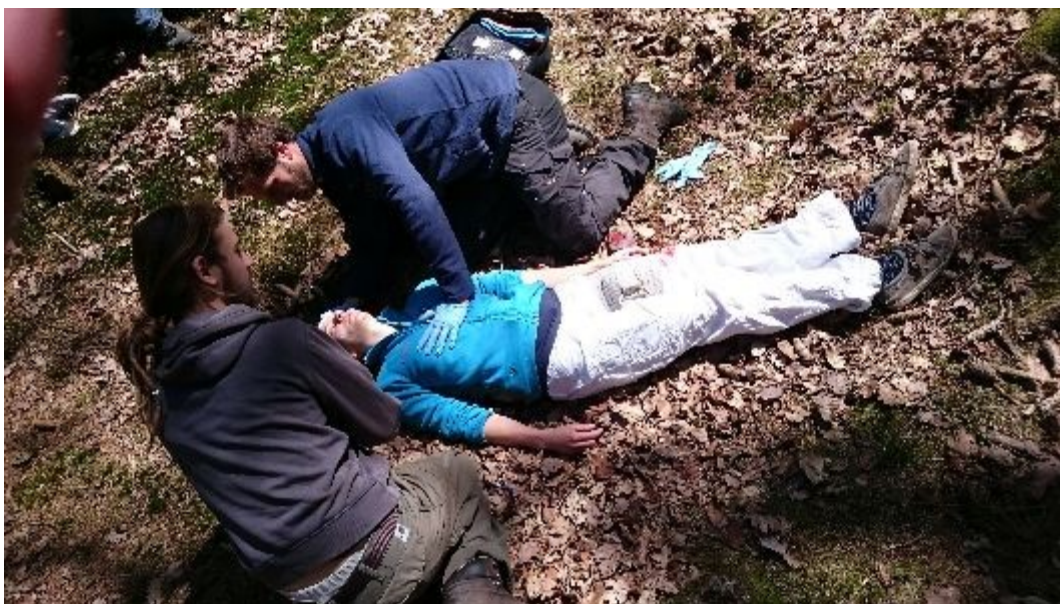
Realistisch trainien staat op de agenda vanaf 1 juni 2020, desnoods met persoonlijke beschermingsmiddelen.